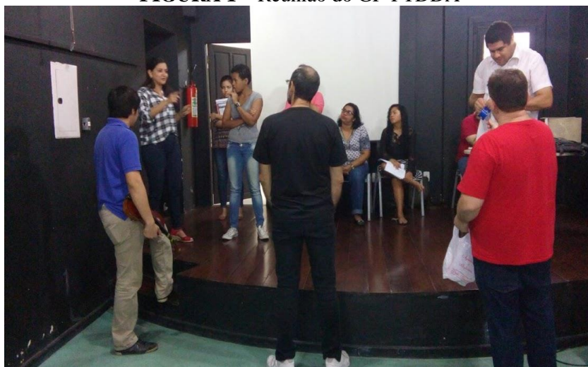
FIGURA 1 – Reunião do GP-PTDDA

Fonte: Arquivo GP-TDDA (PPGArtes/UFGA). Belém/PA 2017.