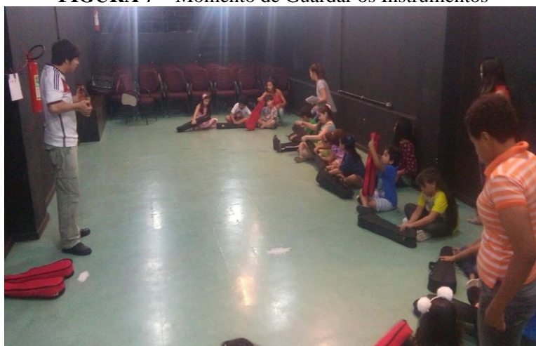
FIGURA 7 – Momento de Guardar os Instrumentos

Fonte: Arquivo GP-TDDA (PPGArtes/UFPA). Belém/PA 2017.