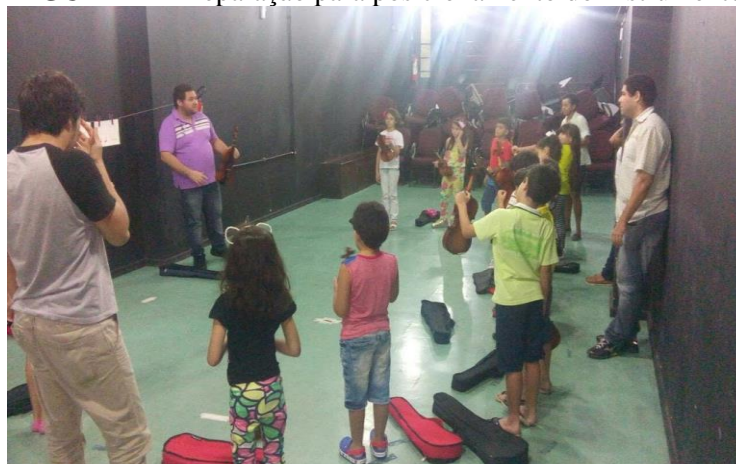
FIGURA 4 – Preparação para posicionamento do Instrumento

Fonte: Arquivo GP-TDDA (PPGArtes/UFPA). Belém/PA 2017.