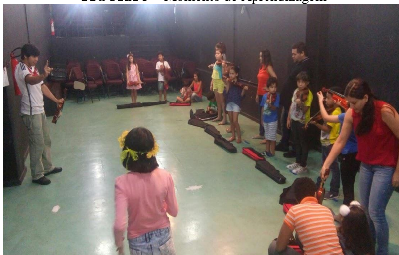
FIGURA 5 – Momento de Aprendizagem

Fonte: Arquivo GP-TDDA (PPGArtes/UFPA). Belém/PA 2017.