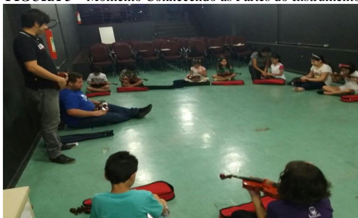
FIGURA 3 – Momento Conhecendo as Partes do Instrumento

Belém/PA 2017.