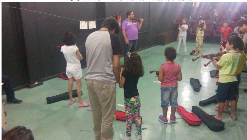
FIGURA 6 – Momento final de aula

Fonte: Arquivo GP-TDDA (PPGArtes/UFPA). Belém/PA 2017.