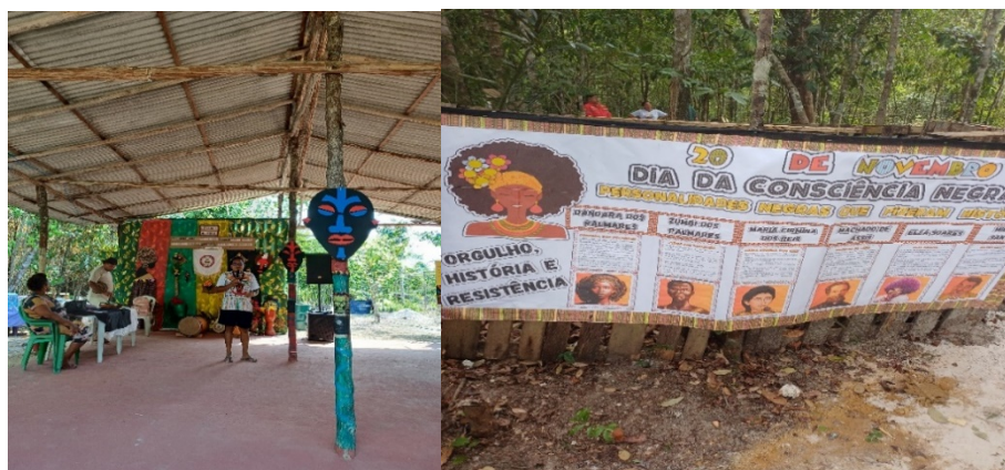
Figura 03: 4º Caribé Cultural