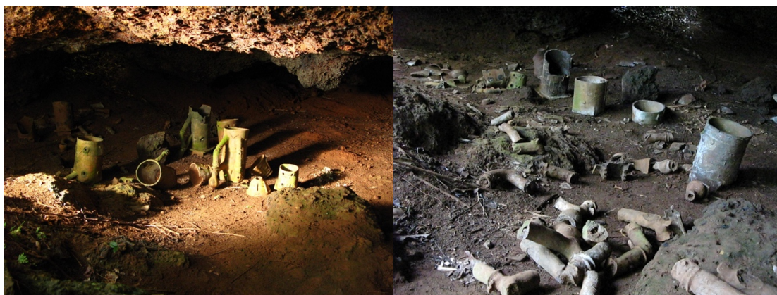
Figuras 3 e 4 – À esquerda, registro da Gruta do Veado realizado durante vistoria do NuPArq/IEPA. À direita, fotografia da Gruta do Desesperado durante o mesmo trabalho na região do Igarapé do Lago. A coleta emergencial do material foi realizada, considerando evidências de deterioração do contexto.

A pesquisa conduzida por Vera Guapindaia pode ser considerada de grande relevância para o desenvolvimento da arqueologia regional e amazônica, especialmente por reforçar a complexidade dos gestos funerários e a importância que aspectos relacionados a morte podem assumir na Amazônia (Guapindaia 2004).