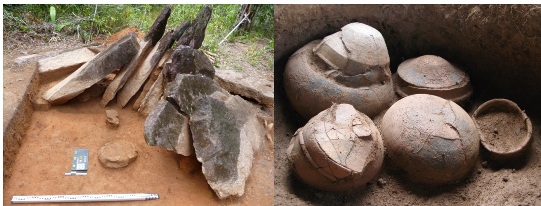
Figuras 1 e 2 – À esquerda, visão geral do alinhamento de rochas no sítio Garrafinha (Ap-CA-38). À direita, deposições do poço funerário 3, na Área 1 do sítio Rego Grande 1 (AP-CA-18).

O sítio Rego Grande 1 é um grande monumento com diversas deposições em seu interior. Durante as escavações, quatro poços foram identificados, com muitos materiais cerâmicos, urnas e/ou acompanhamentos funerários (Cabral & Saldanha 2008). A escavação permitiu identificar práticas cerimoniais contínuas, pois alguns poços foram reabertos para modificações no seu interior e a realização de novas deposições (Saldanha & Cabral 2012a). O sítio Garrafinha (AP-CA-38), por sua vez, é composto por um conjunto de estruturas megalíticas alinhadas e muitas rochas deitadas – possivelmente, recobrendo poços funerários. Em um destes poços (Poço 1), ossos humanos estavam depositados diretamente sobre uma placa de granito em uma câmara lateral. Os remanescentes humanos depositados fora de urna estavam acompanhados 5 vasilhas cerâmicas lisas, interpretadas como acompanhamentos do corpo. O Poço 2 também se caracterizava pela deposição de remanescentes ósseos humanos fora de urna, neste caso acompanhados por uma lâmina de machado polida (Saldanha 2016).