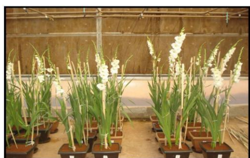
Figura 2. Gladíolos tutorados com bambu.

Os dados foram coletados aos 21 e aos 41 dias após o plantio (DAP) e quando 50% dos vasos estavam florindo. A caracterização do crescimento e produção do gladiólo foi avaliada pela medição do diâmetro de caule medido com o auxílio de uma paquímetro digital, a 5 cm de altura em relação ao solo (21 DAP); do número de folhas incluindo a folha bandeira (41DAP); da altura da planta medida com o auxílio de uma fita métrica do solo até a altura da folha mais alta ( 21 e 41 DAP); da altura da haste floral medida do solo até a altura final da haste floral e do número de flores. Estes dados foram coletados em todas as brotações que surgiram nos dois bulbos plantados em cada vaso, onde se realizou a média das medidas apuradas de todas as brotações de cada parcela.