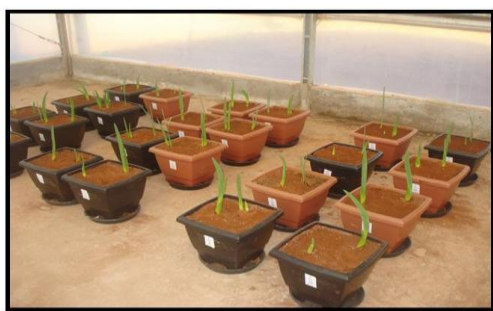
Figura 1. Vista do experimento aos 13 dias após o plantio.

(K 2 O) foi de 50 mg dm -3 na forma de cloreto de potássio e sua aplicação foi parcelada juntamente com a adubação nitrogenada. A adubação com micronutrientes foi de 0,5 mg dm -3 de boro na forma de H 3 BO 3 e 1mg dm -3 de zinco na forma de ZnCl 2 . A adubação com nitrogênio e potássio foi parcelada em quatro vezes, sendo aos 12, 24, 47 e 56 dias após o plantio. Ao longo do ciclo da cultura as plantas foram tutoradas com bambus a fim de evitar o tombamento das mesmas (Figura 2).